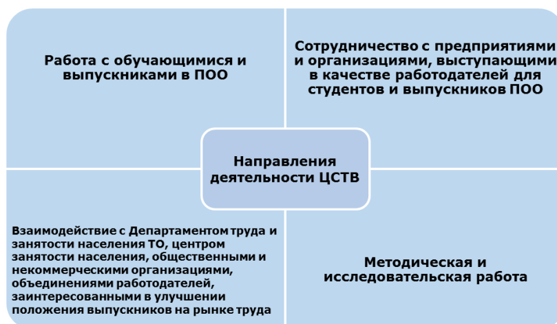
Рис. 1. Основные направления деятельности ЦСТВ

Для деятельности ЦСТВ в Тюменской области целесообразно определить следующие направления, которые, по мнению Ильясова Е.П. и др., являются ключевыми в организации и планировании работы Центров, создаваемых в учреждениях профессионального образования (рис. 1) [26, С.17-30]: