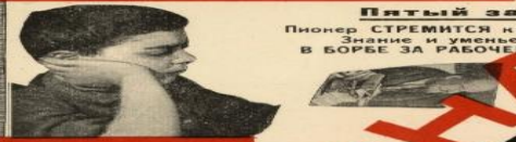
Пятый закон: Пионер СТРЕМИТСЯ к знанию. Знание и умение — СИЛА в борьбе за рабочее дело.