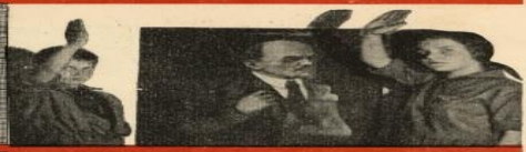
Первый закон: Пионер ВЕРИТ делу рабочего класса — заветам ИЛЬИЧА .