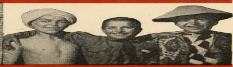
Третий закон: Пионер — ТОВАРИЩ пионерам, рабочим и крестьянским ДЕТЯМ ВСЕГО МИРА .