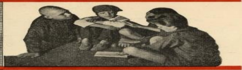
Четвертый закон: Пионер ОРГАНИЗУЕТ окружающих детей и УЧАСТВУЕТ с ними во всей окружающей жизни. ПИОНЕР — ВСЕМ РЕБЯТАМ ПРИМЕР.