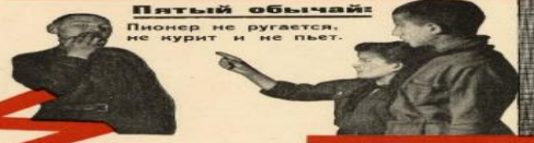
Пятый обычай: Пионер НЕ ругается, НЕ курит и НЕ пьёт.