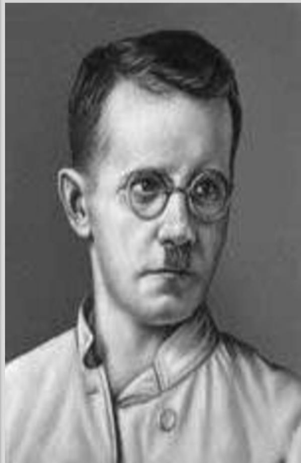
Гастев Алексей Капитонович (1882-1939)