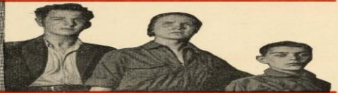
Второй закон: Пионер — МЛАДШИЙ БРАТ и ПОМОЩНИК комсомольцу и коммунисту.