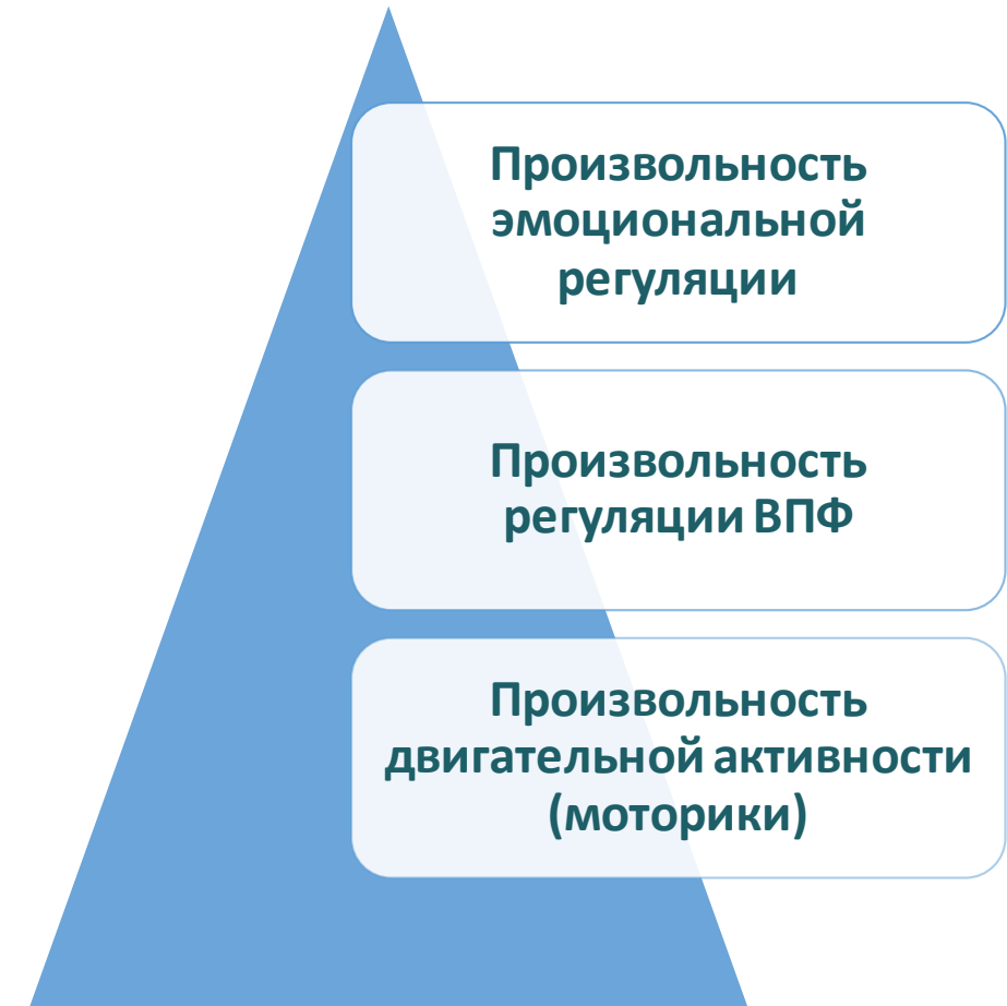
Структура произвольной регуляции Н.Я и М.М. Семаго