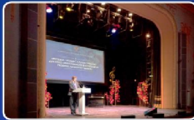
ФОРУМ ИСКУССТВО – УЧИТЕЛЕЙ МУЗЫКИ И ИЗО