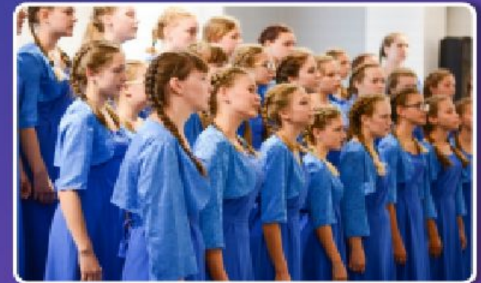
ВСЕРОССИЙСКИЙ КОНКУРС ХОРОВ

25 СЕНТЯБРЯ - 15 ОКТЯБРЯ 2023 г. МДЦ «АРТЕК», 21 ОКТЯБРЯ - 10 НОЯБРЯ 2023г. ВДЦ «ОКЕАН»