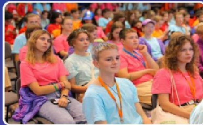
ФОРУМ ЛИДЕРОВ УЧЕНИЧЕСКОГО САМОУПРАВЛЕНИЯ

25 СЕНТЯБРЯ - 15 ОКТЯБРЯ 2023 г. МДЦ «АРТЕК», 21 ОКТЯБРЯ - 10 НОЯБРЯ 2023г. ВДЦ «ОКЕАН»