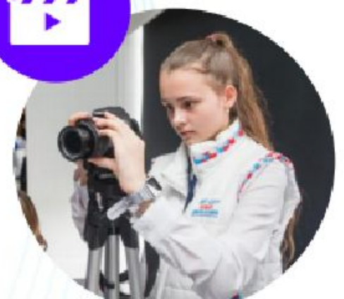
МЕДИА ЦЕНТРЫ КИНОКЛУБЫ