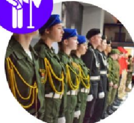
ВОЕННО-ПАТРИОТИЧЕСКИЕ КЛУБЫ, МУЗЕИ