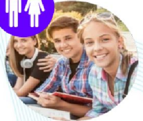
ПЕРВИЧНЫЕ ОТДЕЛЕНИЯ РДМ