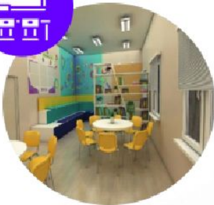
ЦЕНТРЫ ДЕТСКИХ ИНИЦИАТИВ, УЧЕНИЧЕСКОЕ САМОУПРАВЛЕНИЕ