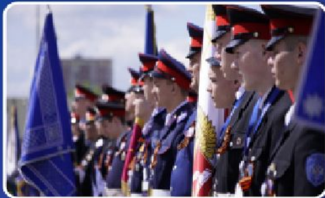
МЕРОПРИЯТИЯ КАЗАЧЬЕЙ НАПРАВЛЕННОСТИ: «ЛУЧШИЙ КАЗАЧИЙ КЛАСС» ДЕКАБРЬ 2023 г.; СПАРТАКИАДА ДОПРИЗЫВНОЙ КАЗАЧЬЕЙ МОЛОДЕЖИ, «КАЗАЧИЙ СПЛОХ» 25 - 29 СЕНТЯБРЯ 2023 г.; ПТО 10-14 ОКТЯБРЯ 2023 г.