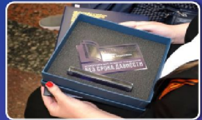
ВСЕРОССИЙСКИЙ ФЕСТИВАЛЬ ТВОРЧЕСКИХ ВОЗМОЖНОСТЕЙ «БЕЗ СРОКА ДАВНОСТИ» ДЕКАБРЬ 2023г.