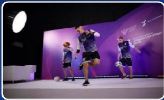
ФОРУМ СПОРТИВНЫХ КЛУБОВ ШКОЛ И СПО