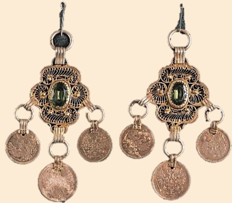
Чулпы – наконечники. Серебро 19 век.

• Так же данный прием применим и для орнаментирования ювелирных украшений. Например, орнаменты на наконечниках имеют непрерывную линию, ведь отличительной особенностью является, что в отдельных местах должны обязательно соприкасаться между собой и внутренней частью предмета, окаймляющей украшение.