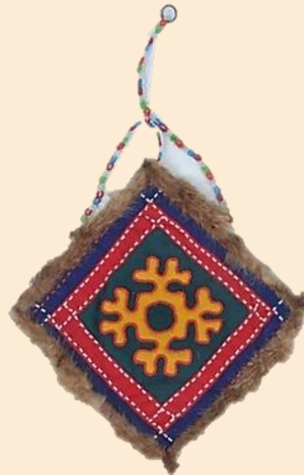
Игольница орнаментированная. Национальное наименование: Намт. Тюменская обл., Ханты-Мансийский АО, Белоярский