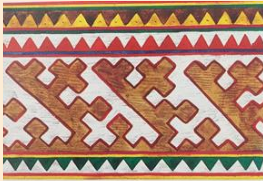
Эскиз меховой мозаики с элементами орнамента в виде рогов оленя.