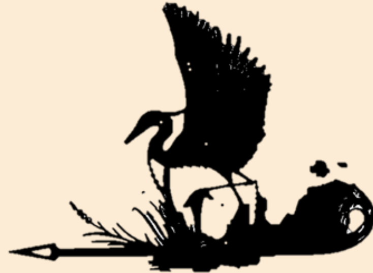
Флюгер в г. Тюмени. Современная обработка металла. Изготовление декоративных изделий