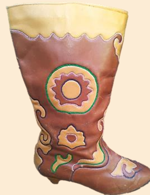
Фрагмент сапожек. Ичиги. Тюменский район, с. Ембаево