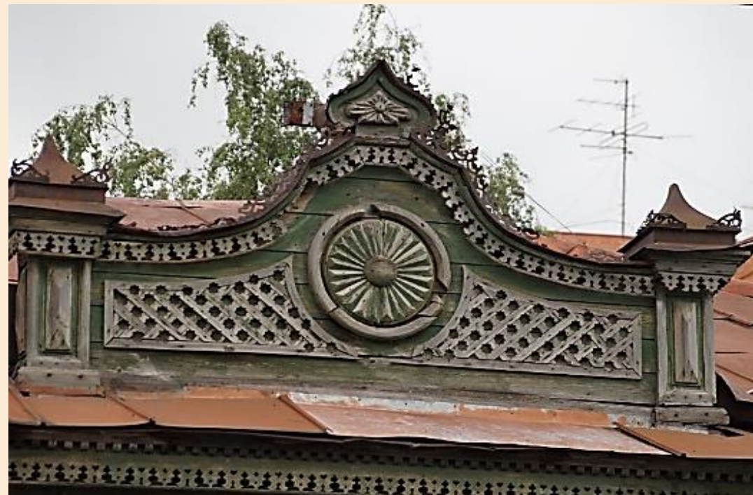
Солярная символика в домовый резьбе. г. Тюмень, ул. Хохрякова, 24