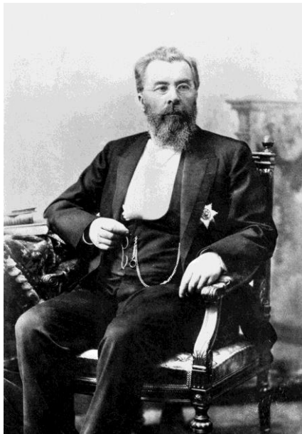
Николай Васильевич Склифосовский