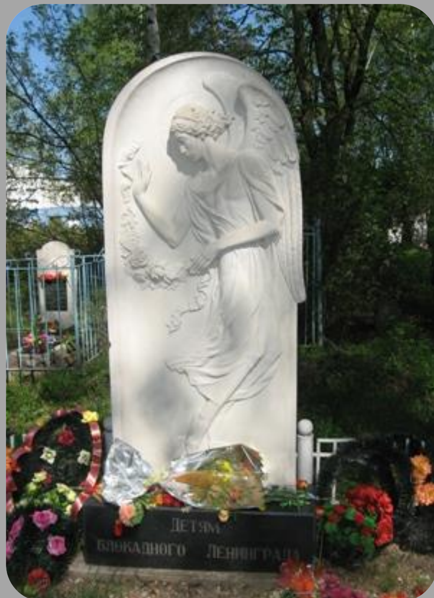
В Ярославле памятник жертвам блокадного Ленинграда.

Знак установлен в 2008 г. в память жертвам блокадного Ленинграда