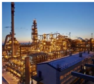
АО «Антипинский нефтеперерабаты- вающий завод»