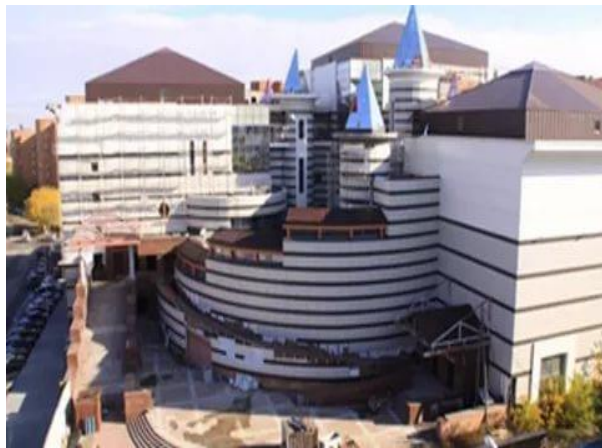
Музейный комплекс им. И.Я. Словцова