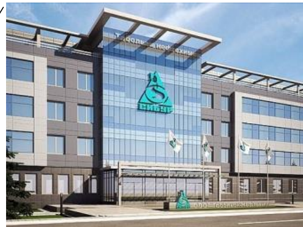
«ООО СИБУР Тобольск»