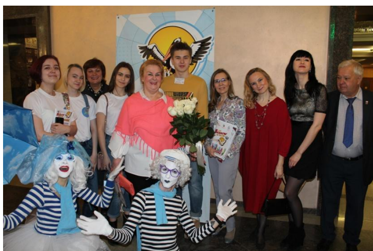
Фото с организаторами конкурса.