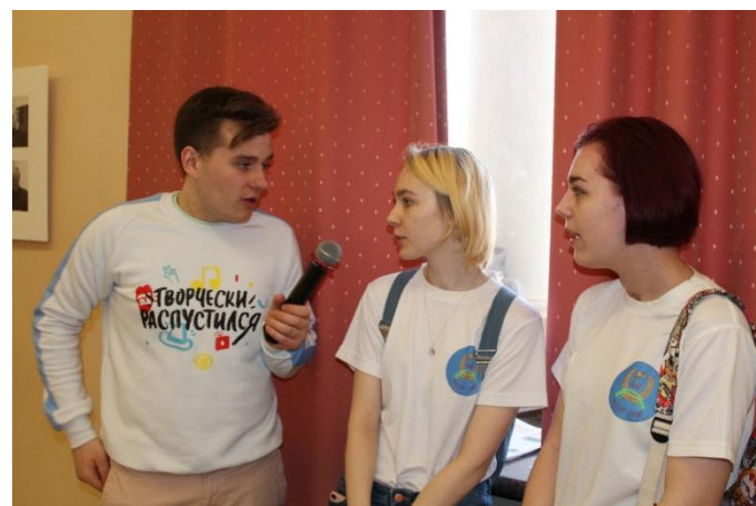
Теперь у нас берут интервью. Волнительно.