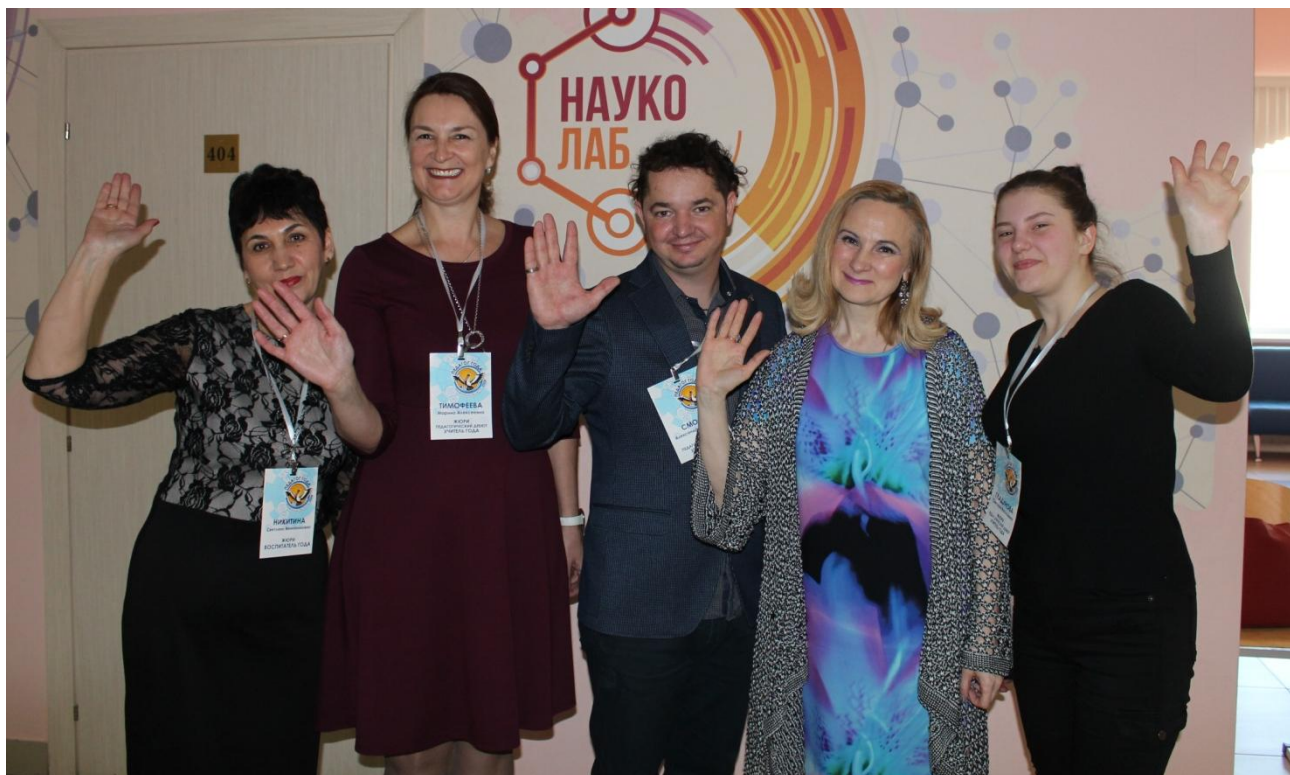
Члены жюри в номинации "Педагогический дебют" (учитель)

Не сомневаюсь. Будучи членом российского жюри, из года в год прослеживаю путь продвижения простого учителя в завучи, в директора, а то и в управленцы в системе образования. Это такая точка роста, когда аккумулируется все лучшее в педагоге, когда личностно происходит качественный скачок в мышлении, происходит раздвижение горизонтов. И, конечно, не может не быть успеха впереди. А многие защищают диссертации.