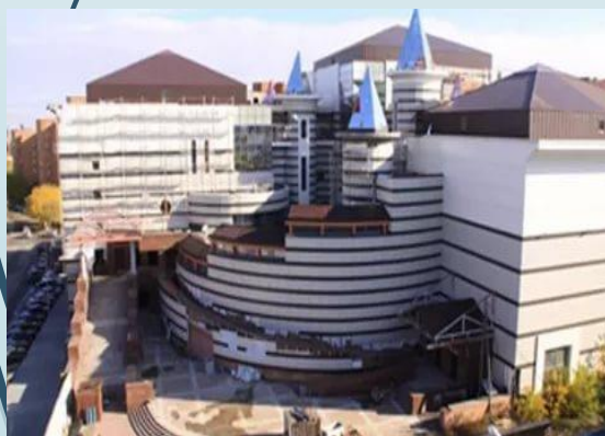
Музейный комплекс им. И.Я. Слоцова