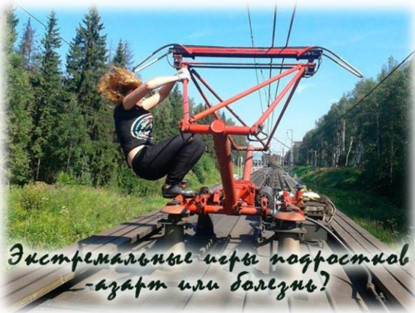
Экстремальные игры подростков - азарт или болезнь?