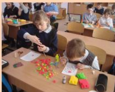
Творческая мастерская « Мартовский цветок»