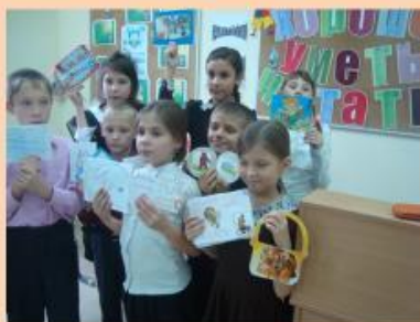
« Книжки — малышки» для дошколят