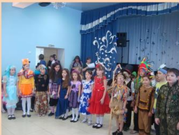
На новогоднем карнавале