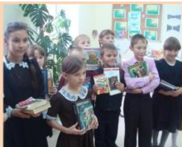
Акция « Подари книгу библиотеке»

Нами собрано около 50 различных книг, журналов, раскрасок, энциклопедий.