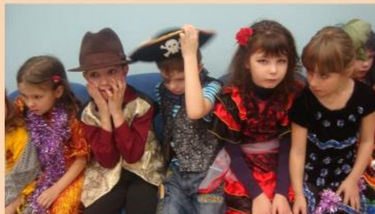
Новый год к нам мчится!