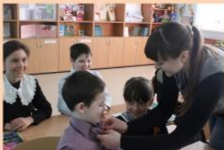
Акция « Георгиевская ленточка »