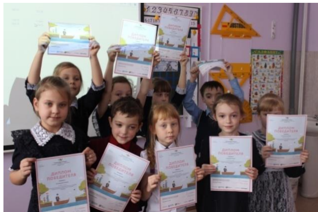
Постоянные участники интерактивного портала " Учи. ру"