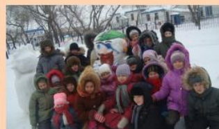
Семейный проект «Эта школьная дорожка нас к пирату привела!»