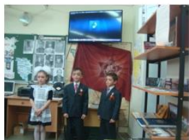
Поём «Последний бой»