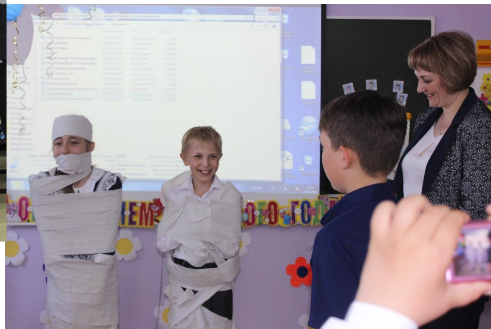
Игра от родителей