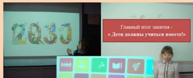
Главный итог занятия - « Дети должны учиться вместе!»

Нами собрано около 50 различных книг, журналов, раскрасок, энциклопедий.