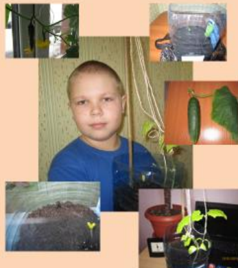
"Шаг в будущее"