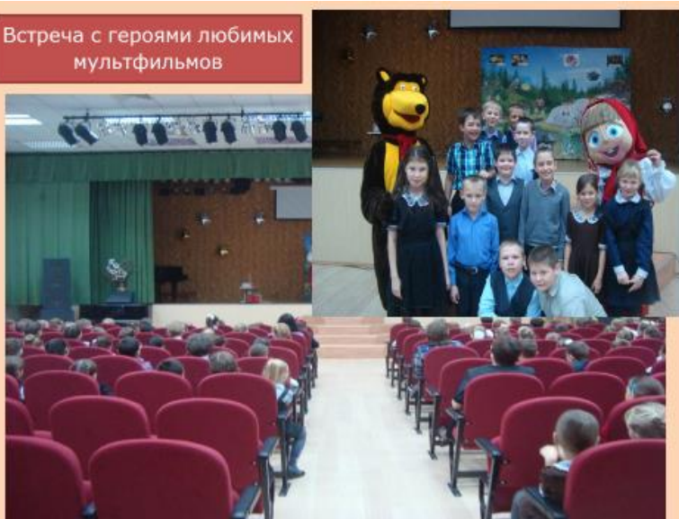
Встреча с героями любимых мультфильмов