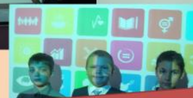
« Самый большой в мире урок»