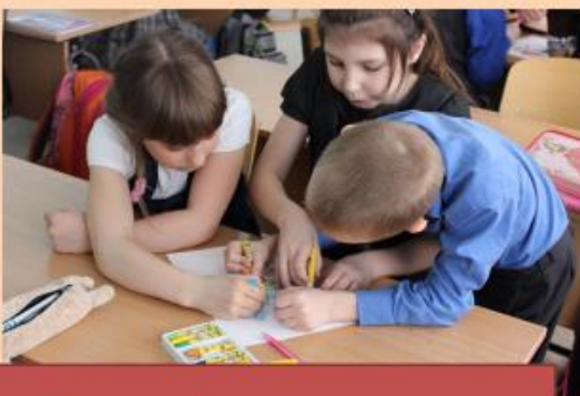
« В гостях у Андерсена»