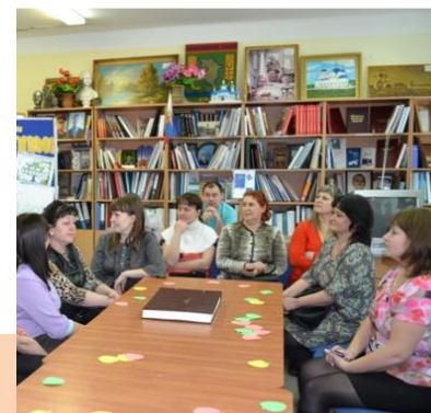
«Моя семья – мои истоки»