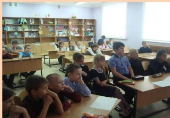
Занимательная викторина «Герои любимых книг»